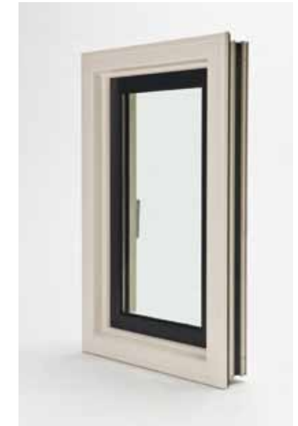
Variant: Schüco Raam AWS 65 Accent met Schüco TipTronic

Wanneer aan de brandwerende eis EW30 moet worden voldaan, kan nu ook de variant van de Schüco Corona CT 70 Accent worden toegepast. In een project waar sprake is van enkele elementen met zeer grote kozijnafmetingen biedt de variant een oplossing. Daarnaast kan met deze serie de weerstandklasse WK3 bereikt worden en zijn automatisch te bedienen ramen met Schüco TipTronic mogelijk. Ondanks dat de eigenschappen variëren, kunnen beide systemen naast elkaar worden gemonteerd zonder dat er verschillen zijn in vormgeving, kleur en afmeting. Naast brandwerende raamkozijnen is het ook mogelijk om deuren 30 minuten brandwerend te maken.