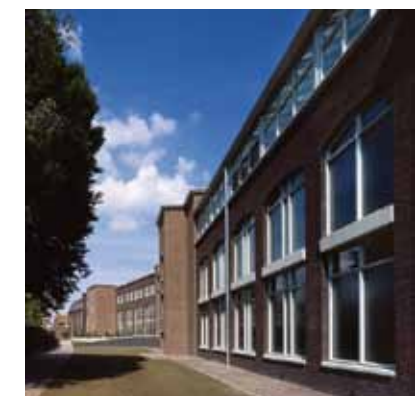
Ook toepasbaar in gebouwen met brandwerende eisen