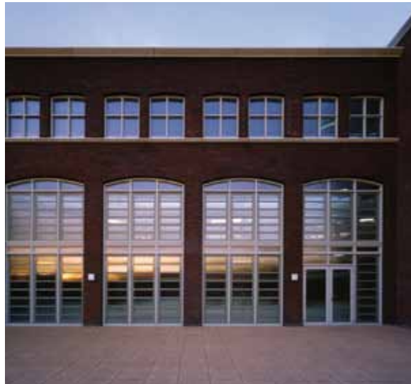
Een gunstige energiebalans vergroot de waarde van een project