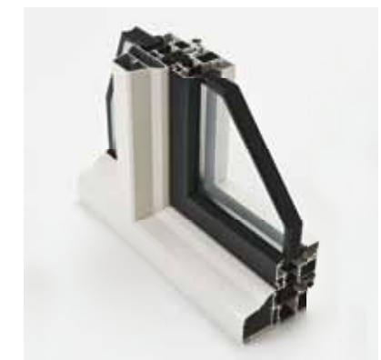
Variant: Schüco Raam AWS 65 Accent